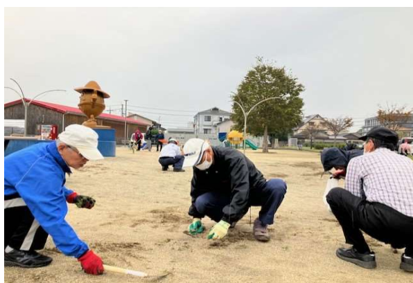
童心に帰って砂場の掃除