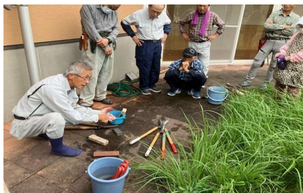
砥石の使い方は---そうそう