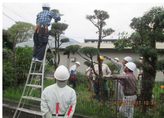
斜めに切ったがよいよ---そうそう