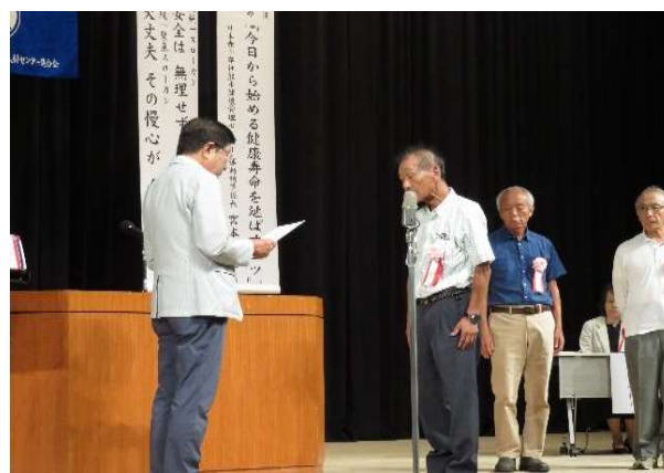
会長賞を受ける樋口会員